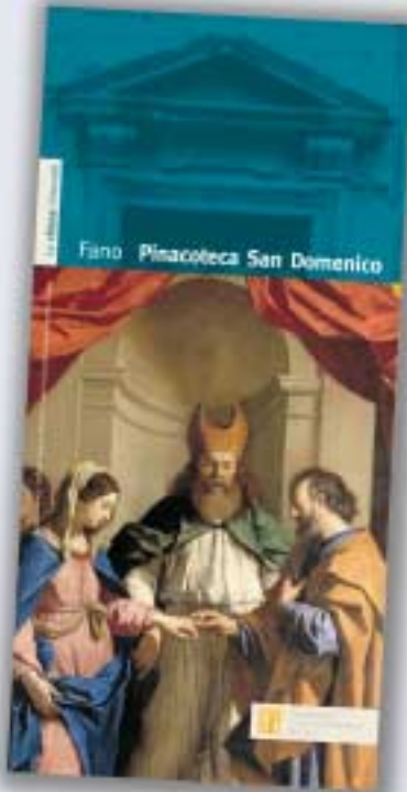
Dépliant della Pinacoteca San Domenico in distribuzione gratuita ai visitatori.