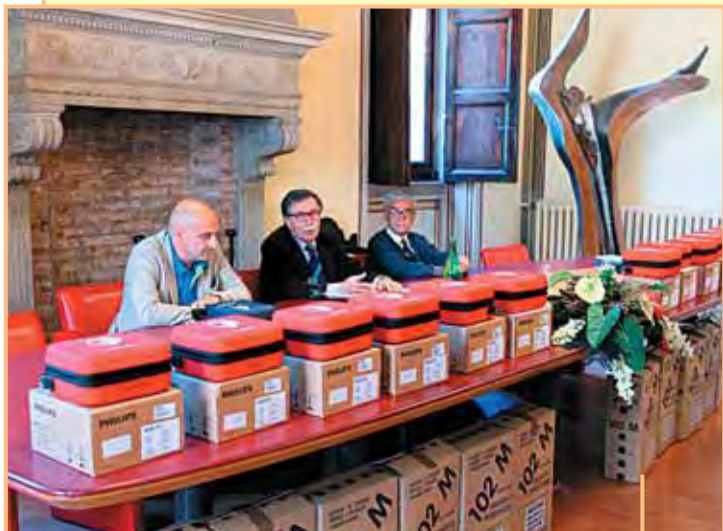
maggio Alcuni momenti della consegna dei defibrillatori donati dalla Fondazione ad Enti, Associazioni e Istituzioni