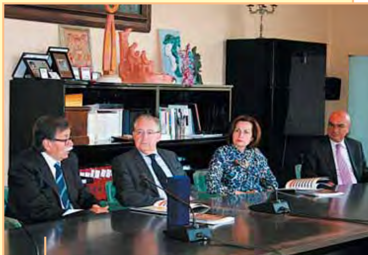
7 maggio 2015 Visita del Prefetto di Pesaro e Urbino e Consorte