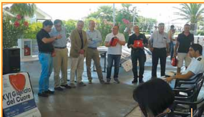
4 luglio 2015 - XVI Giornata del Cuore Tensostruttura Sassonia - Un momento della consegna dei defibrillatori alle scuole del territorio