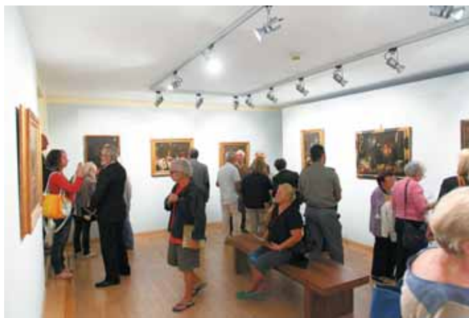
Due momenti dell'inaugurazione della Mostra

Si ringrazia il dott. Diotallevi per la brillante idea e per l'impegno profuso nella stesura delle pubblicazioni e nell'organizzazione dell'evento.