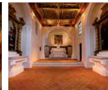
A fianco, la chiesa del Gonfalone di Saltara al momento dell'acquisto e il suo l'interno a restauro ultimato.