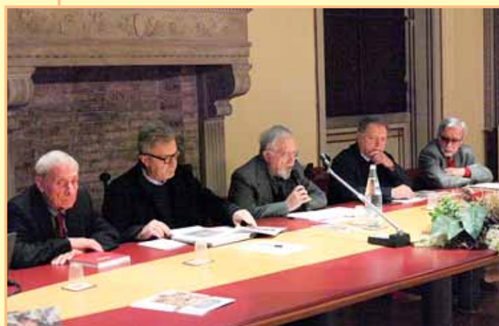
Tavola rotonda sul politico di Monte S. Pietrangeli "Ipotesi attributive sul dipinto"