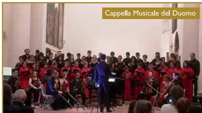
Cappella Musicale del Duomo

Un folto e divertito pubblico ha accolto anche quest'anno la terza edizione delle "Domeniche al San Domenico" che, per la prima volta, ha visto l'esibizione di alcune Scuole di musica e Corpi bandistici, oltre che nella Pinacoteca, anche all'interno del Cortile del Nespolo di Palazzo Bracci Pagani.