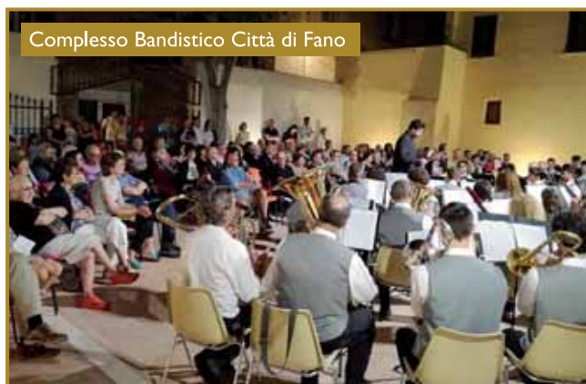
Complesso Bandistico Città di Fano