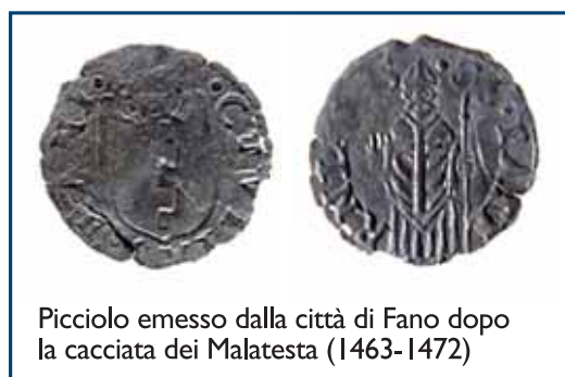
Picciolo emesso dalla città di Fano dopo la cacciata dei Malatesta (1463-1472)