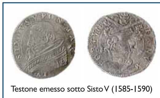
Testone emesso sotto Sisto V (1585-1590)

L'acquisizione di queste importanti monete ha ulteriormente colmato i pochi vuoti della collezione che ci auguriamo di colmare in futuro.