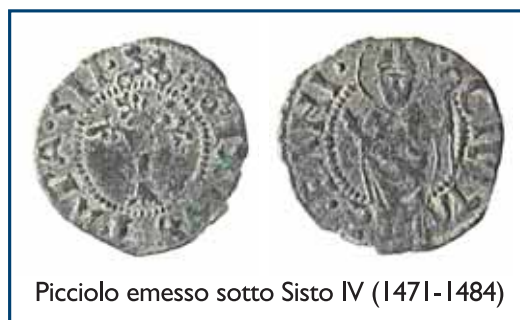
Picciolo emesso sotto Sisto IV (1471-1484)