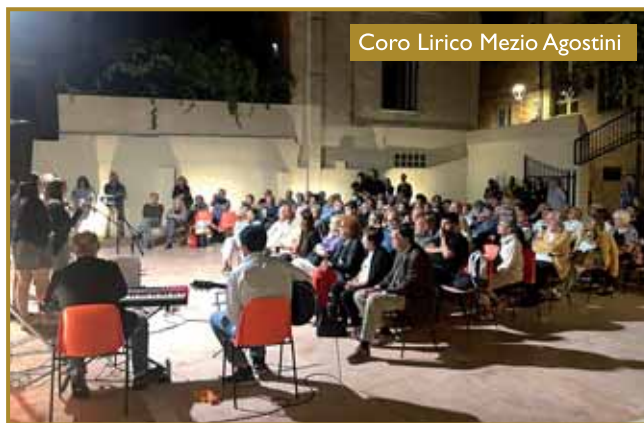
Coro Lirico Mezio Agostini

I concerti vocali e strumentali hanno occupato quasi tutte le domeniche estive a partire dal 21 maggio e sino al 23 settembre.