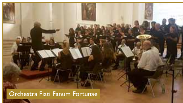
Orchestra Fiati Fanum Fortunae