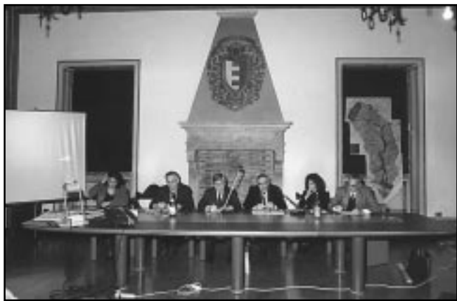
Presentazione dei primi risultati della ricerca, Fano 17 dicembre 1999

Il materiale di deposito delle casse d'espansione potrebbe essere utilizzato per il ripascimento delle spiagge.