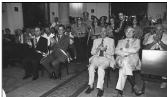
Restituzione alla collettività di Orciano dei cori della Chiesa di S. Maria Novella (restauro finanziato dalla Fondazione). Cerimonia dell'1.07.2000

Ora l'Assemblea dei Soci dovrà provvedere alla revisione del suo regolamento interno per adeguarlo alle nuove norme statutarie.