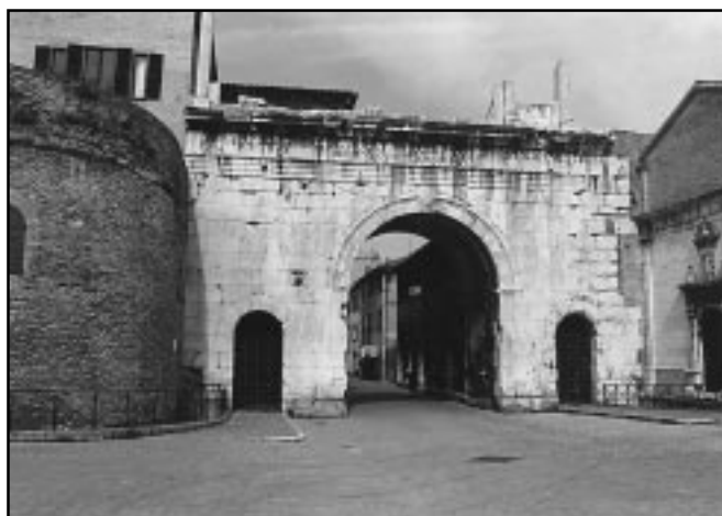
Arco d'Augusto - Fano

un soggiorno-cura in montagna a beneficio dei ragazzi portatori di handicap;