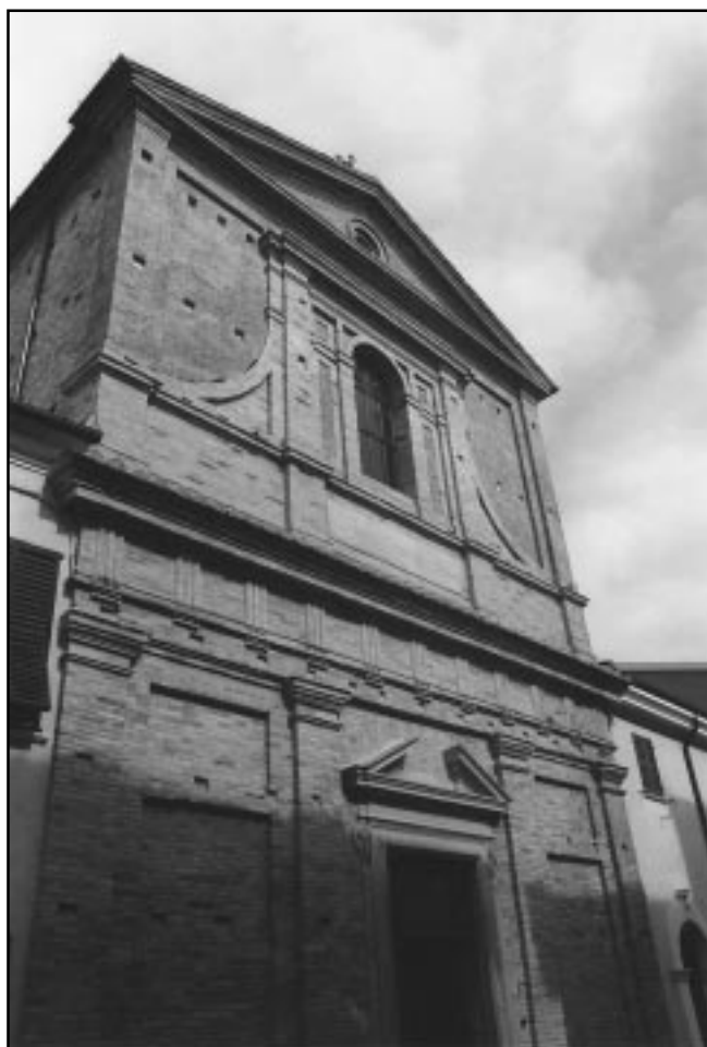
Chiesa di "S. Agostino" a S. Costanzo restaurata con il contributo della Fondazione (1999)

Fano - Sala di rappresentanza della Fondazione: Assemblea dei Soci della Fondazione Cassa di Risparmio di Fano per l'elezione di un consigliere e di due sindaci revisori.