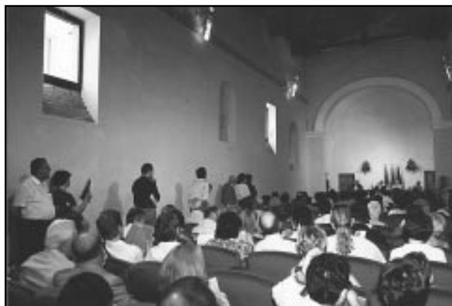
Inaugurazione, il 1° luglio 2000, della sala polivalente "Santa Caterina" di Orciano, dopo il restauro finanziato in sinergia tra la Fondazione, il Comune e la Carifano S.p.A.