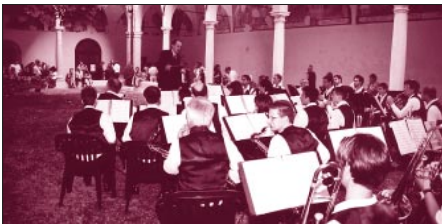
16 giugno 2001 - Inaugurazione del Chiostro dell'ex Convento di S. Agostino

Il prossimo numero del notiziario sarà dedicato integralmente al bilancio 2000 che sin da quest'anno si arricchisce, secondo le prescrizioni del Ministero del Tesoro, del "Bilancio di missione" che nella sostanza la nostra Fondazione ha da sempre redatto nel contesto del documento in parola.