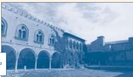
Nella foto di archivio la "Corte Malatestiana" a Fano com'era qualche lustro fa