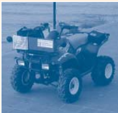
Il mezzo a quattro ruote dell'Associazione "Fano Cuore" (già Cardiopatici) del progetto "Soccorso Spiaggia" donato dalla Fondazione.