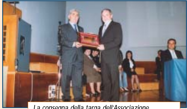
La consegna della targa dell'Associazione Trapiantati d'Organo delle Marche alla Consulta Regionale delle Fondazioni Marchigiane