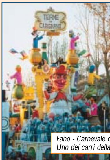
Fano - Carnevale dell'Adriatico 2004 Uno dei carri della sfilata