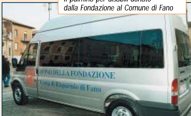
Il pulmino per disabili donato dalla Fondazione al Comune di Fano