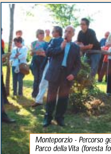
Monteporzio - Percorso geonaturalistico nel Parco della Vita (foresta fossile): un momento della cerimonia di inaugurazione