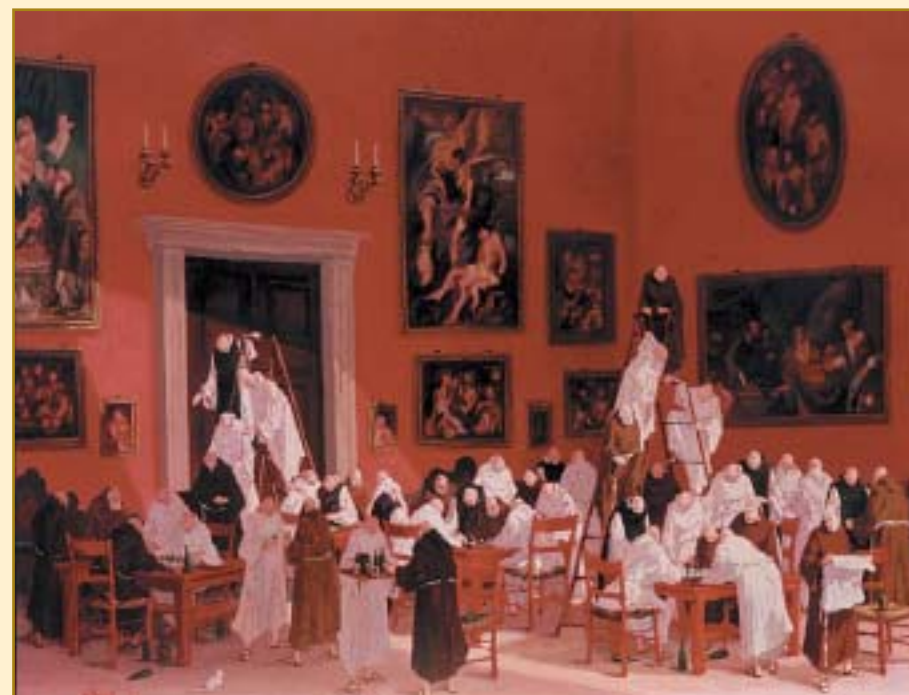
L'ultimo acquisto dell'importante dipinto di Enzo Bonetti "Partita a scacchi in convento" che è andato ad arricchire la sezione di arte moderna della nostra Quadreria.