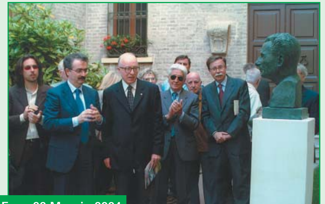
Fano 22 Maggio 2004

Un momento della cerimonia per la inaugurazione del busto dedicato al grande scrittore fanese Fabio Tombari, realizzato su iniziativa del locale Lions Club con il contributo della Fondazione e sistemato nel giardinetto della biblioteca Federiciana.