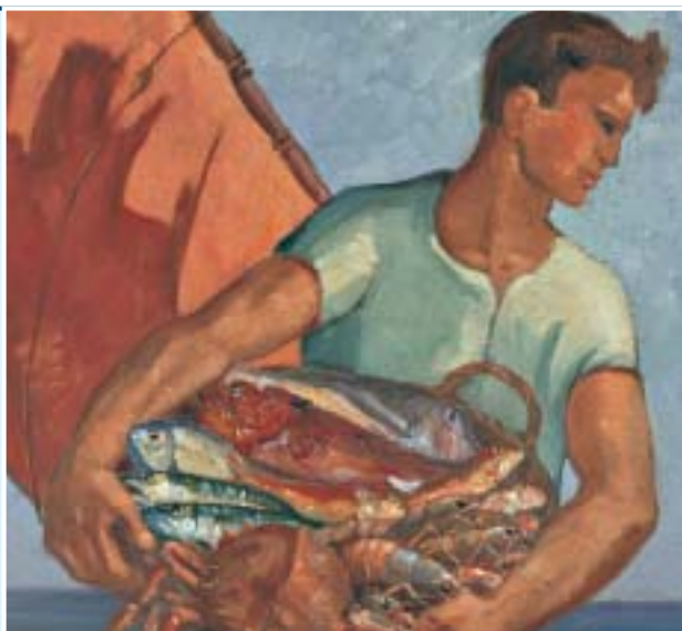
"Il marinaio", dipinto del pittore fanese Rino Fucci, donato dalla Famiglia alla Fondazione.

Nel 4° trimestre 2004 si sono tenute le seguenti riunioni: Consiglio di Amministrazione (5, 19 ottobre – 23 novembre – 9, 22 dicembre), Consiglio Generale (7, 28 ottobre), Gruppo di lavoro "Arte, attività e beni culturali" (11 ottobre), Gruppo di lavoro "Assistenza Categorie Sociali Deboli" (11 ottobre), Gruppo di lavoro "Educazione, istruzione e formazione" (11 ottobre), Gruppo di lavoro "Salute pubblica, medicina preventiva e riabilitativa" (11 ottobre), Commissione "Salute pubblica, Medicina preventiva e riabilitativa" (6 dicembre) Commissione "Protezione e qualità ambientale" (7 dicembre), Commissione "Arte, attività e beni culturali" (15 ottobre, 3 dicembre), Commissione "Assistenza Categorie Sociali Deboli" (6 dicembre) Commissione "Finanziaria e Bilancio" (12 novembre), Commissione "Educazione, istruzione e formazione" (7 dicembre).