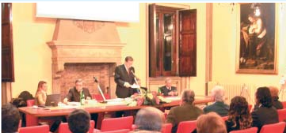
25 novembre 2005 Presentazione dei depliant delle "Chiese ritrovate" e del "Quaderno dei restauri" (2002-2004).