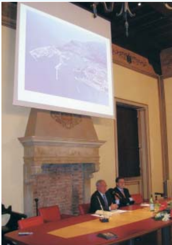
Conferenza del 4 novembre 2005 del Presidente dell'Autorità Portuale di Ancona, Giovanni Montanari sul tema "Mare come risorsa: la nuova autostrada"