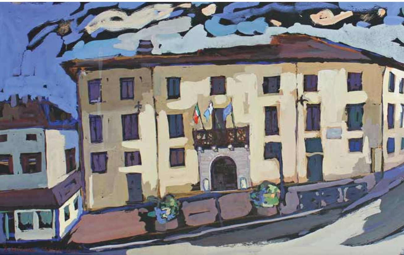
Palazzo Cassi di Natale Patrizi, Agrà marzo 2013