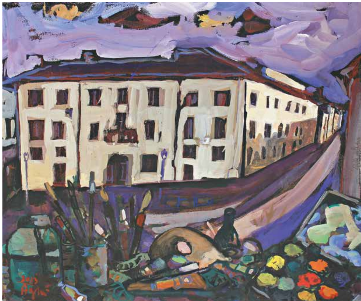
Palazzo Cassi di Natale Patrizi, Agrà marzo 2013